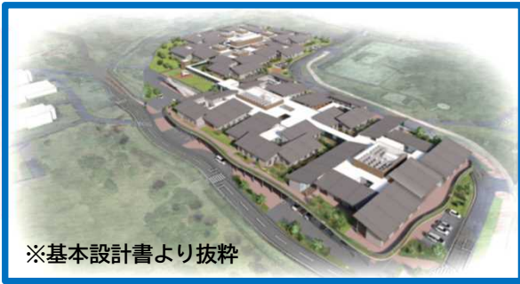
【▼あすなろの郷セーフティネット棟イメージ図①】