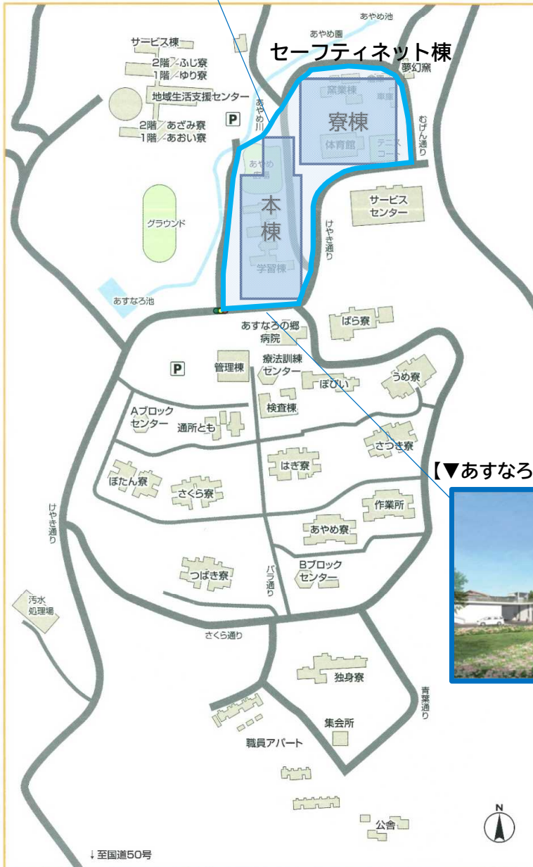
【▼あすなろの郷セーフティネット棟イメージ図②】